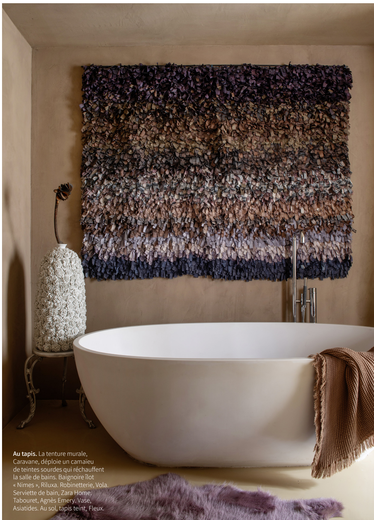
Au tapis. La tenture murale, Caravane, déploie un camaïeu de teintes sourdes qui réchauffent la salle de bains. Baignoire îlot « Nîmes », Riluxa. Robinetterie, Vola. Serviette de bain, Zara Home. Tabouret, Agnès Emery. Vase, Asiatides. Au sol, tapis teint, Fleux.