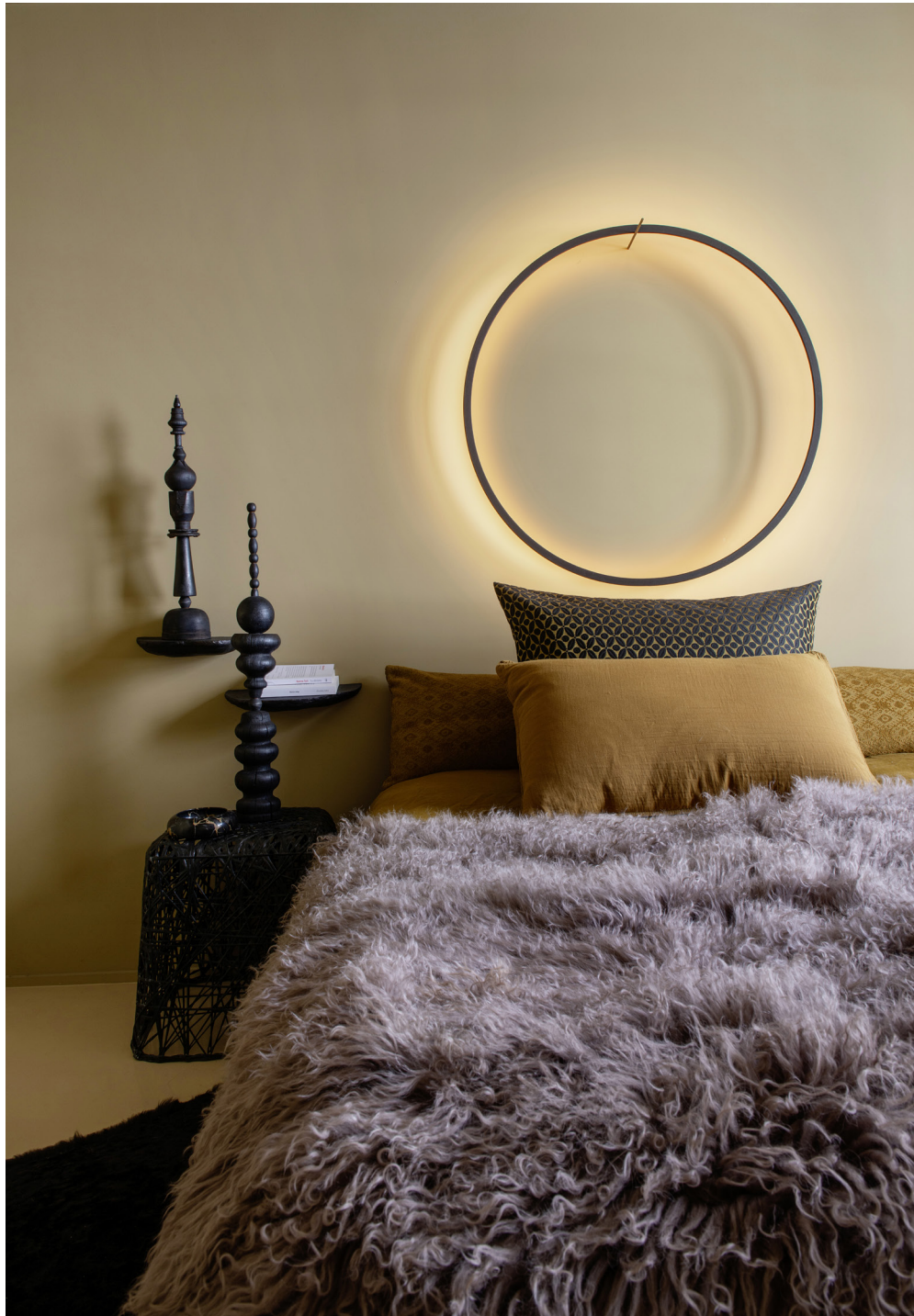
À GAUCHE Halo de lumière dans la chambre avec l'applique « Eclipse », Tilen Sepic. Linge de lit, La Redoute Intérieurs. Dessus-de-lit, Zoeppritz. Étagères, H&M Home. Totems en bois brûlé, Victor Totems. Table de chevet chinée. Murs et plafond peints dans le coloris « Milano », Argile.

AU CENTRE Coin lecture cocooning dans la chambre de Laurence, avec une chaise et un tabouret, H&M Home. Lampadaire « Sofisticato », Serax. Au mur, des compositions florales, LM Les Fleurs. Posé au sol, miroir rond, AYTM. Sur le lit, couverture, Society Limonta. Tapis en soie, Ornate. Murs et plafond peints dans le coloris « Bois Bouchon », Argile.