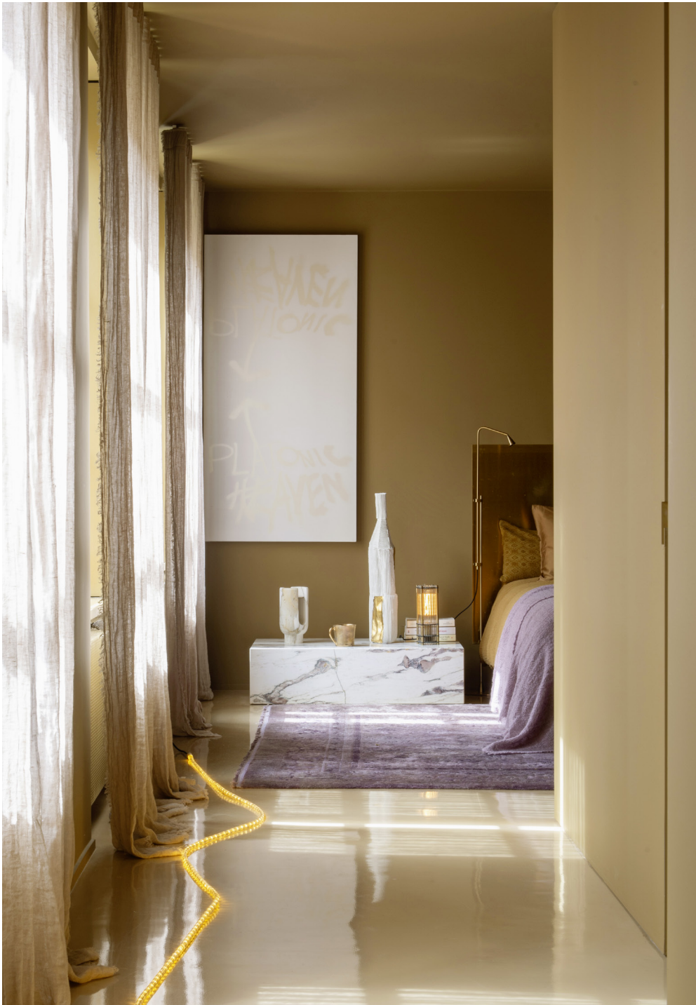
À DROITE Parcours d'une guirlande lumineuse serpentant au sol, un couloir mène à la chambre. Chevet en marbre « Plinth », Audo Copenhagen. Vase « Bottle », Paola Paronetto. Bougie, oOumm. Lampe « Tower Light », Neptune Glassworks. Rideaux « Nude », Maison de Vacances. Tableau Plutonic Heaven d'Aaron Young.